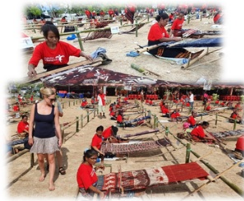
Event pariwisata di Kabupaten Banjarnegara, Jawa Tengah, Indonesia