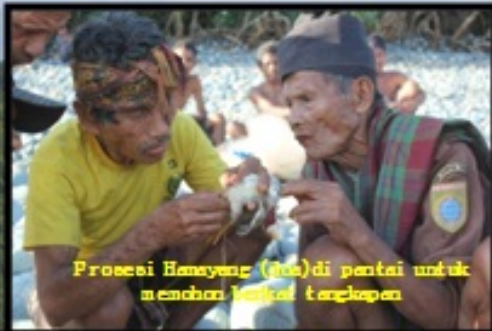
Prosesi Hanyang (doa) di pantai untuk memohon karahi tangkapan