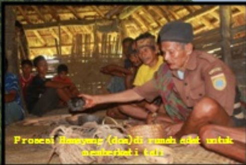
Prosesi Hanyang (doa) di rumah adat untuk memberkati tali