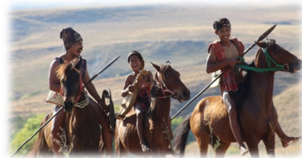
Event pariwisata di Kabupaten Banjarnegara, Jawa Tengah, Indonesia

Sabtu, 18 May 2013 12:29 - Terakhir Diperbaharui Selasa, 10 Maret 2020 21:08