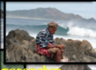
Menunggu waktu yang tepat untuk menangkap