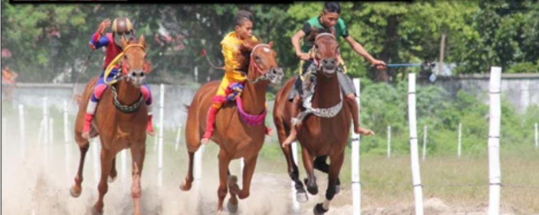
FESTIVAL PARADE DAN PACUAN KUDA SANDEL DAN TENUN IKAT KABUPATEN SUMBA