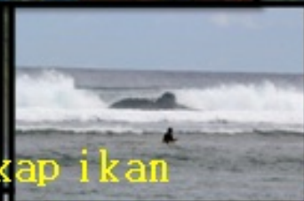
Pemasangan tali perangkap ikan